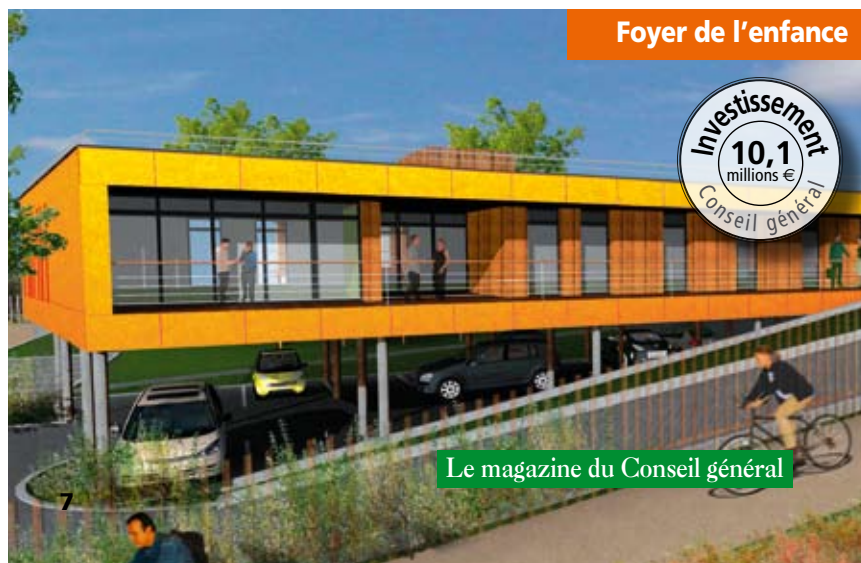
Foyer de l'enfance