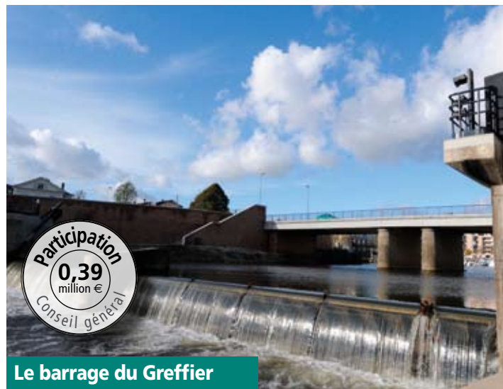
Le barrage du Greffier

Toutes ces interventions traduisent la forte participation du Conseil général au développement harmonieux de la ville chef-lieu du département.