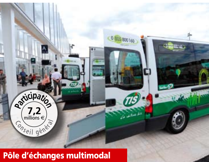
Pôle d'échanges multimodal