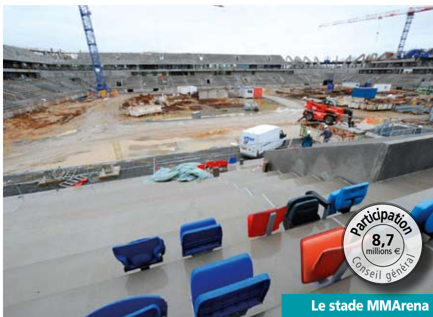
Le stade MMArena