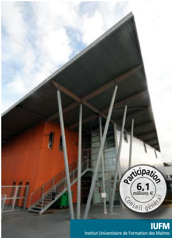
IUFM Institut Universitaire de Formation des Maîtres

Placée au cœur du département, la ville du Mans bénéficie du soutien appuyé et conséquent du Conseil général, incontournable partenaire dans la mise en œuvre de la plupart des grands chantiers d'infrastructures qui préparent l'avenir de la cité. Il accompagne aussi de nombreuses actions de développement qu'elles soient à caractère économique, éducatif ou culturel et intervient au quotidien en faveur des manceaux dans le domaine social.