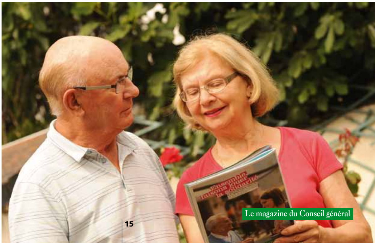
Le magazine du Conseil général

► Contact : www.cg72.fr www.cidpaclic.sarthe.org