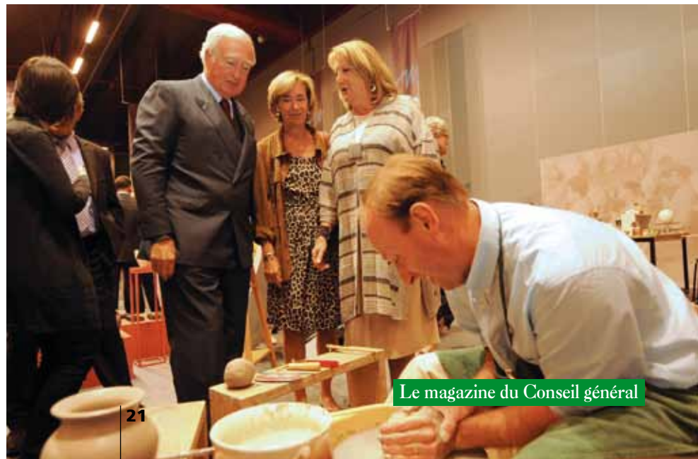
Le magazine du Conseil général

nommé puisque l'Espace Faïence de Malicorne vient de recevoir le label : Musée de France. Et pour marquer cet événement important, il a présenté au public quelques unes de ses plus belles pièces et proposé des démonstrations de fabrication. Après une période estivale favorable sur le plan des visites, l'Espace faïence de Malicorne ne pouvait espérer meilleure façon de lancer sa saison hivernale, qui sera ponctuée de nombreuses animations et expositions de qualité.