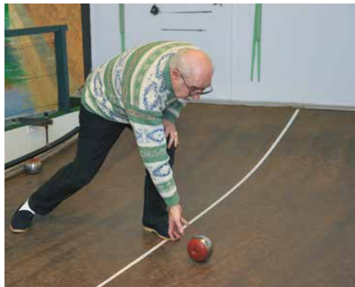
Texte et photographies de Gilles Kervella

De nos jours, le jeu de boules de fort reste plus qu'un simple divertissement, il est un lien,